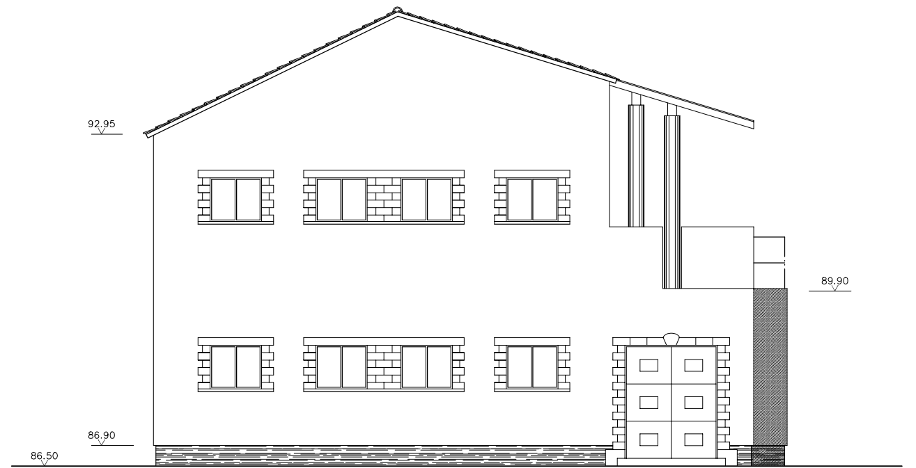
ALZADO LATERAL ESCALA 1:50